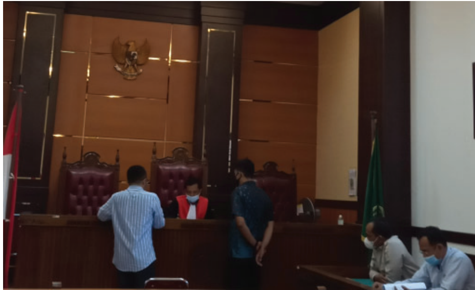
Hakim tunggal Juandra tengah melihat bukti yang diajukan oleh pihak termohon dalam hal ini Polda Sumatera Barat (Sumbar).