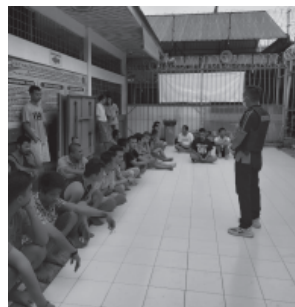
Suasana uji melakukan sterilisasi di semua kamar dalam Lapas Kelas IIB Payakumbuh