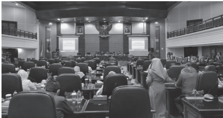
Suasana rapat paripurna di DPRD Sumbar

"Dua kebijakan pemerintah daerah diduga melanggar peraturan perundang-undangan, khususnya peraturan pemerintah nomor 12 tahun 2019 tentang pengelolaan keuangan daerah. Usul hak angket diajukan para pengusul tidak memenuhi ketentuan pasal 115