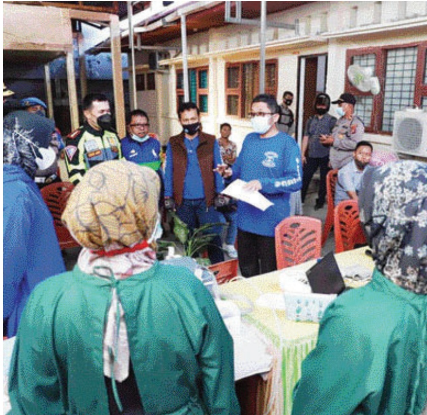
Padang Kejar Target Vaksinasi Lansia