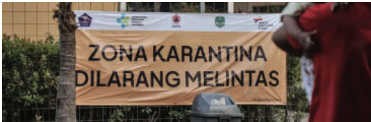
Sebuah lokasi karantina di Jakarta

Jakarta, Khazanah -- Keras benar hati ke luar negeri, pergilah. Tapi ketika nanti masuk Indonesia harus karantina sepekan penuh, jangan pula minta dispensasi kiri kanan.