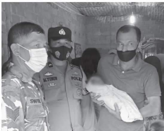
BAYI— Warga Kampung Rawa Gemulau, Nagari Simpang Lama Inderapura, Kecamatan Pancung Soal, Kabupaten Pesisir Selatan dikejutkan dengan penemuan seorang bayi perempuan dengan posisi terlentang diteras rumah tanpa pakaian, Minggu (9/1) sekitar pukul 04.00 WIB dini hari.