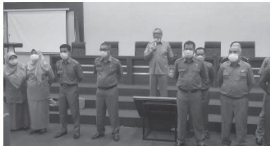
MEMERINTAHKAN - Wali Kota Payakumbuh Riza Falepi memerintahkan jajarannya untuk bisa mengajar sasar vaksinasi Covid-19.

Payakumbuh, Khazanah — Terus tancap gas, Wali Kota Payakumbuh Riza Falepi memerintahkan jajarannya untuk bisa mengajar sasaran vaksinasi Covid-19 di kota yang berjuluk The City of Randang ini, supaya apabila sewaktu waktu varian baru virus ini masuk ke Kota Payakumbuh, warganya sudah dimuniasi. "Kita termasuk yang serius mengurus masalah Covid-19. Persoalan Covid-19 belum berakhir, mumpung belum datang varian yang baru dari virus ini, justru itu kita giat membangun herd immunity dengan memberikan vaksinasi kepada masyarakat," kata Riza saat memimpin apel pagi di