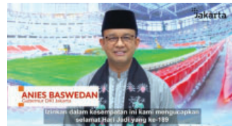
Anies Baswedan sampaikan selamat HJK pada Padang Pariaman

Gubernur DKI Jakarta Anies Baswedan melalui video testimoniya mengatakan, momentum HJK ke-189 ini menjadi tentu merupakan kesempatan untuk makin memperkuat semangat memfasilitasi warga untuk maju, berkembang, apalagi di masa pascapandemi nanti, Insya Allah.