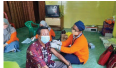
Capaian Vaksinasi Lansia Sudah 48 Persen