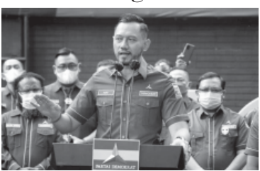
ELEKTABILITAS Partai Demokrat tiba anjlok dari 10,6 persen menjadi 4,9 persen. Kondisi ini salah satunya diduga akibat meredanya konflik di tubuh partai berlogo mercu tersebut. Demokrat dinilai kehilangan momentum sejak tiga bulan belakangan.

Jakarta, Khazanah— Temuan survei Indonesia Elections and Strategic (IndEX) Research menunjukkan elektabilitas Golkar dan Demokrat turun dalam tiga bulan belakangan. Golkar dari 8,7 persen menjadi 7,0 persen, sedangkan Demokrat anjlok dari 10,6 persen menjadi 4,9 persen. Demokrat yang sepanjang tahun 2021 menikmati lonjakan elektabilitas tampaknya kehilangan momentum, seiring redanya konflik di tubuh partai berlogo mercu tersebut. Sementara itu Golkar meskipun turun tetapi kembali ke posisi ketiga, setelah PDIP dan Gerindra. PDJ Perjuangan juga turun, tetapi tetap unggul dengan elektabilitas mencapai 16,7 persen, disusul Gerindra 13,5 persen. Secara umum partai-partai cenderung stagnan, hanya Partai Solidaritas Indonesia (PSI) yang mengalami tren kenaikan elektabilitas dan kini mencapai 5,4 persen. "Elektabilitas partai-partai politik cenderung stagnan, sementara itu Golkar dan Demokrat turun, sedangkan PSI terus naik," kata peneliti IndEX Research Reza Reinaldi dalam siaran pers di Jakarta, pada Minggu (9/1/2021). Menurut Reza, kenaikan elektabilitas PSI terutama disumbang dari strategi partai pro-milennial tersebut