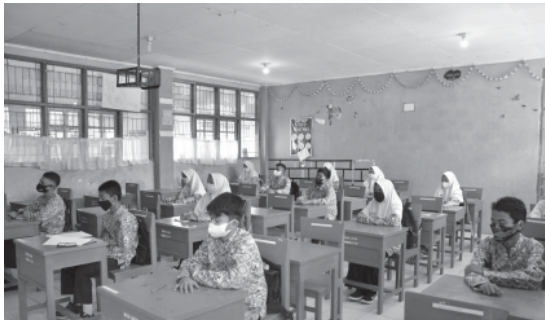
TERBATAS — Setelah dua bulan berada dalam status Level 1 PPKM, Pemerintah Kota Padang Panjang mulai Senin (10/1) melaksanakan Pembelajaran Tatap Muka 100 persen secara terbatas. Pembelajaran tatap Muka ini dilaksanakan dengan menerapkan penuh protokol kesehatan.

sebagai inspektur upacara di Pondok Pesantren (Pontren) Kauman Muhammadiyah Padang Panjang, Senin (10/1), Kapolres, AKBP Novianto Taryono, SH, SIK, MH sampaikan pesan utama pemerintahan terhadap dunia pendidikan di kota itu